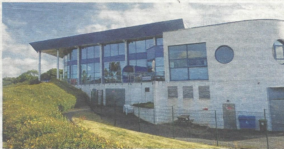
Loïc Raoult, président de la communauté de communes, Hugues Lesage, président de la commission sport et animation de la communauté et Jean-Michel Gravaud, directeur de l'espace aqualudique ont présenté le programme et les nouveautés de l'été.

Programme vacances (certificat médical). Chaque 2 semaines soit initiation à la natation pour les enfants à partir de 5 ans, de 9 h 10 à 9 h 55 (76 € les 10, cours) ; Soit apprentissage natation, à partir de 7 ans de 9 h 10 à 9 h 55 ou de 10 h 05 à 10 h 50 (76 € les 10